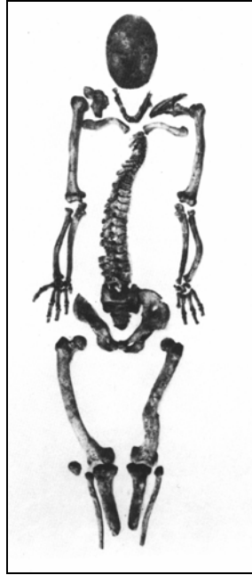
7. mynd. Útbreiddur Pagetssjúkdómur, sem sést á bognum lærlegg og hrygg, í tíundu aldar engil-saxneskri beinagrind.