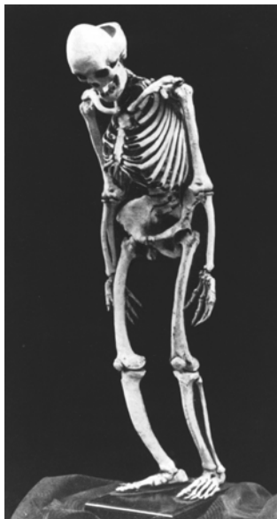
4. mynd. Beinagrind úr manni með alvarlegt tilfalli Pagetssjúkdóms sem tók til hauskúpu og efri og neðri útlíma.

Pagetssjúkdómur hefur e.t.v. einnig haft áhrif á andlitsfall Egils. Sagan gerir meira en að segja Egil einfaldlega ljótan. Útliti hans er lýst nákvæmlega og leitt í ljós að Egill áleit sjálfan sig áberandi ljótan. Í kveðskap sem sagan eignar Agli vísar hann hvað eftir annað til höfuðs síns, oft á undarlegan hátt. Til vitnis er vísan sem Egill orti þegar svarinn óvinur hans, Eiríkur konungur blóðöx, hafði gefið honum upp sakir. Þar segir Egill (61. kafli):