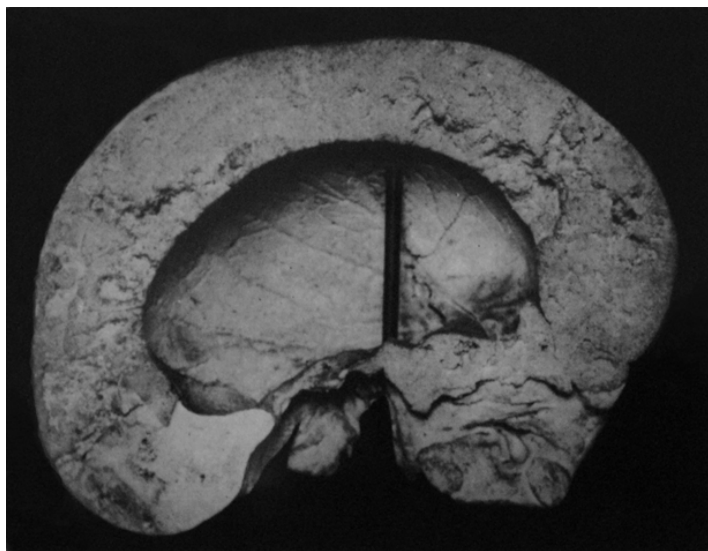
6. mynd. Þykknuð pagetísk hausjúpa. Þratt fyrir beinasamvextina voru vitsmunir viðkomandi óskaddaðir.